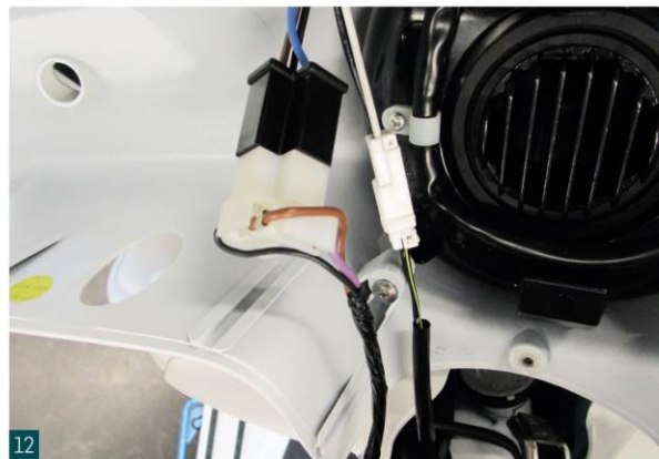
LED-Scheinwerfer einstecken. Anschließend erfolgt der Zusammenbau in umgekehrter Reihenfolge. Connect LED headlight. Reassembly in reverse order.