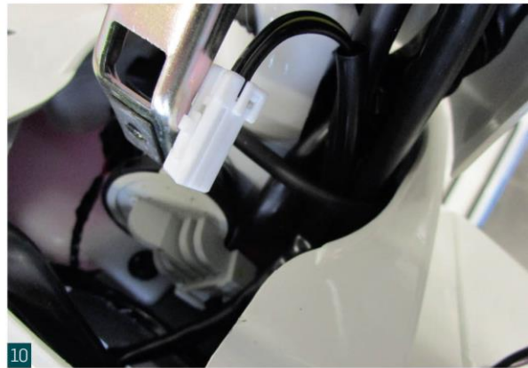
Anschluss für das Tagfahrlicht zum Lenker verlegen. Move daytime running light plug to handlebar.