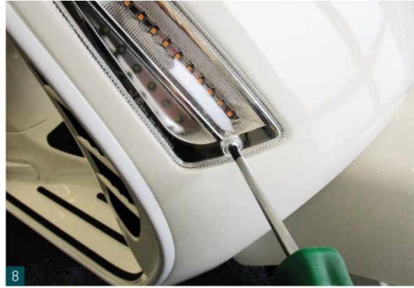
Einen Blinker vorne lösen. Unscrew a front indicator.