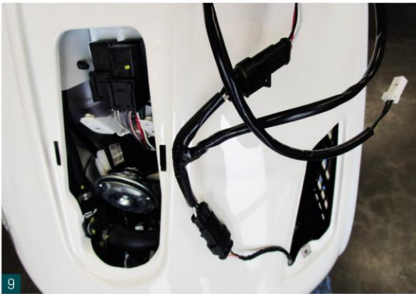
Bei Fahrzeugen von Bj. 2014-2018: Adapter für Tagfahrlicht einfügen. For scooters with year of construction from 2014 to 2018 use adapter for daytime running lights.