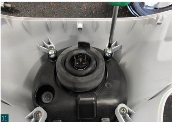
Scheinwerfer montieren. Mount headlight.