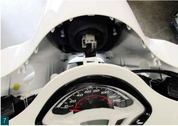
Lenkerverkleidung nach vorne abziehen. Scheinwerferstecker abziehen. Pull handlebar cover forward. Remove headlight plug.