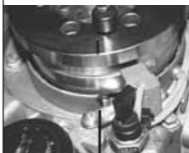
Tacca sul carter Notch on the crankcase